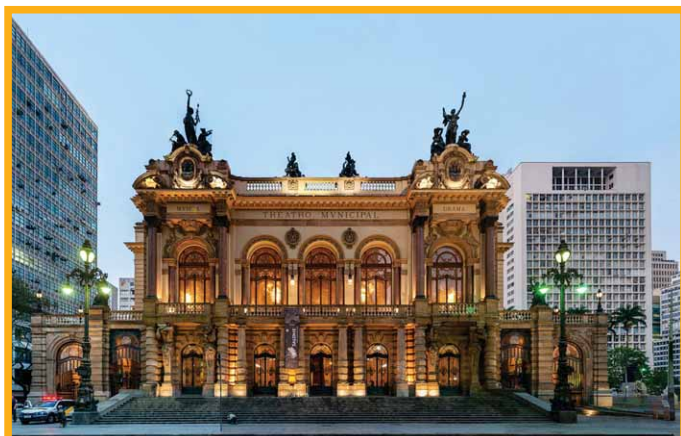
No dia 27/07/2018 o KORU CENTRO-DIA organizou uma visita com os idosos e profissionais da casa ao THEATRO MUNICIPAL DE SÃO PAULO.