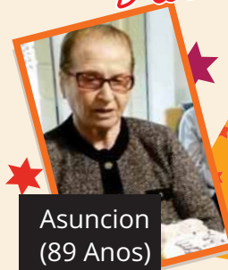
Asuncion (89 Anos)