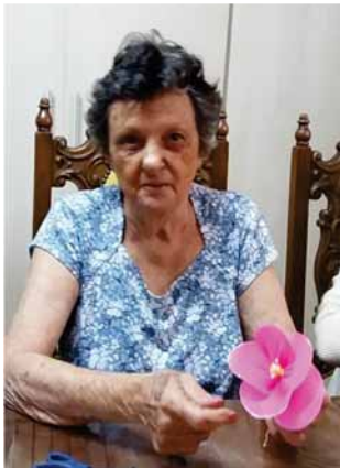
Flor de meia de seda