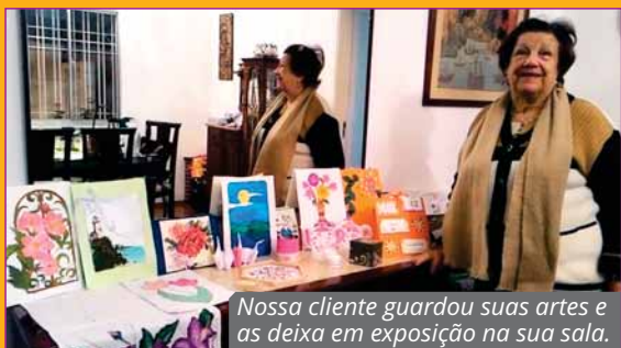
Nossa cliente guardou suas artes e as deixa em exposição na sua sala.

As atividades de lazer visam integrar, divertir e relaxar o grupo. Através de propostas desafiadoras o arte-educador estimula e resgata o prazer pela arte utilizando recursos de diversos tipos e materiais com múltiplas texturas e cores. O idoso se alegra com o resultado do trabalho realizado e com a sensação de capacidade que é trabalhada nesta oficina.